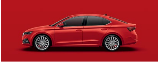
CORRIDA RED UNI