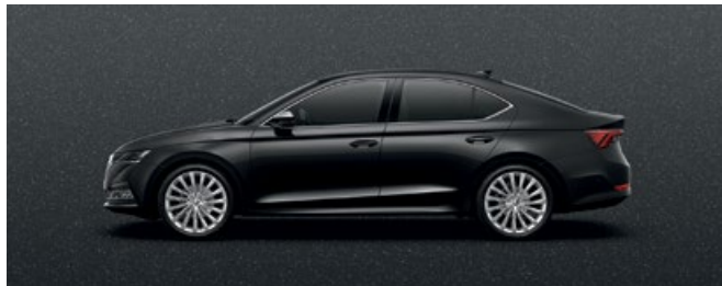
MAGIC BLACK METALLIC

DISCLAIMER : SUBJECT TO CHANGE WITHOUT NOTICE