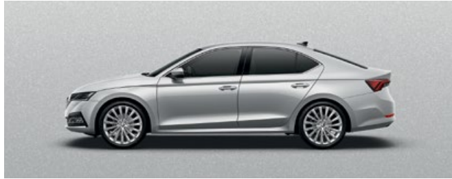
BRILLIANT SILVER METALLIC