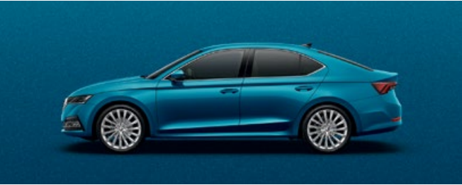
LAVA BLUE METALLIC