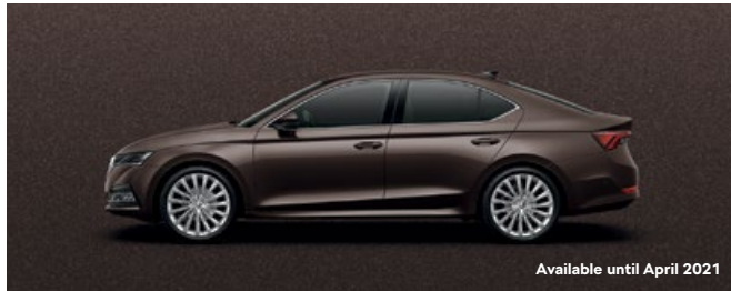
MAPLE BROWN METALLIC