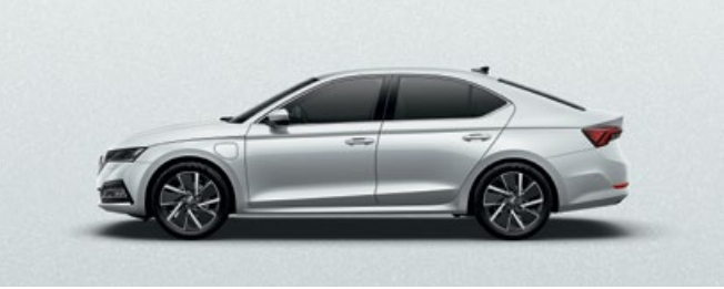
CANDY WHITE UNI