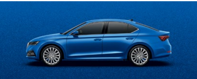
RACE BLUE METALLIC