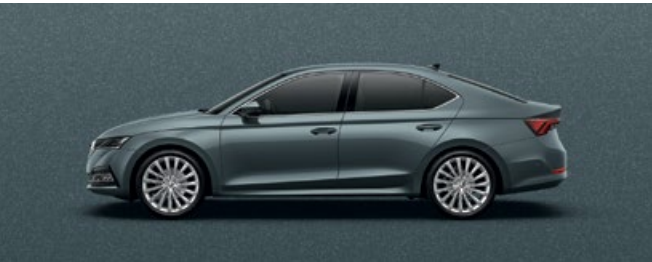
QUARTZ GREY METALLIC